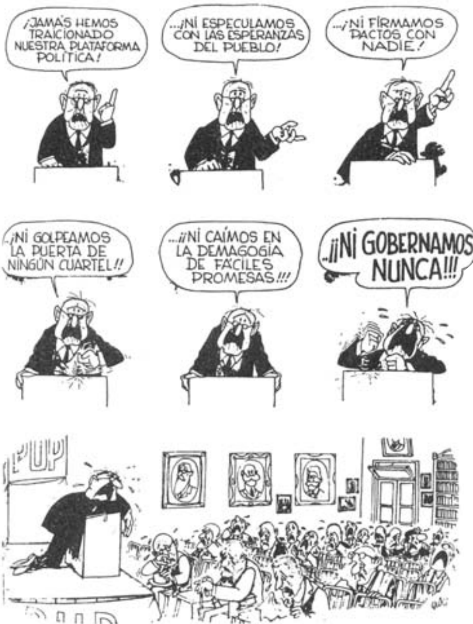
Quino, A mí no me grite . Siglo XXI, s. a. México, 1980.

Entonces, tendemos a decir que la política es cosa “de otros”, de aquellos “que hacen política”.